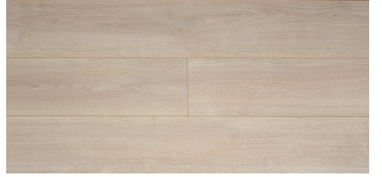
2100 - SOFT MEŞE