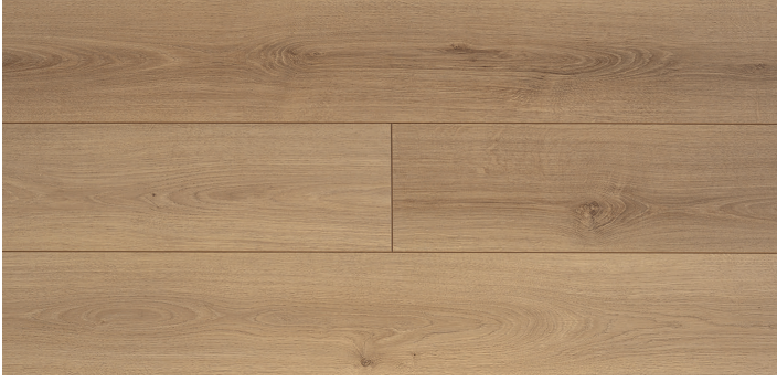
625 - NATUREL MEŞE