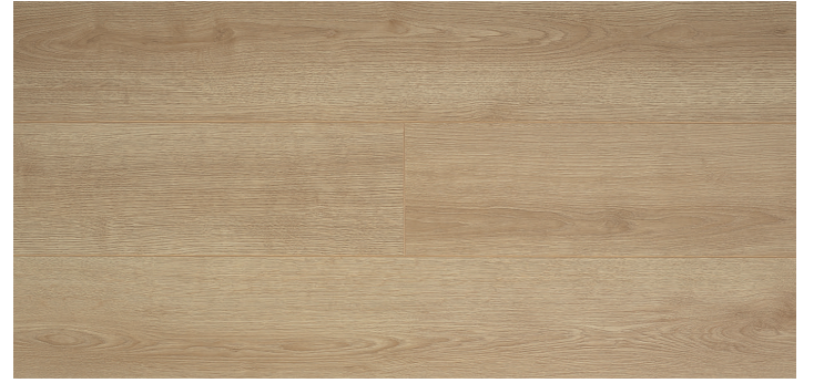
2102 - BELGRAD MEŞE