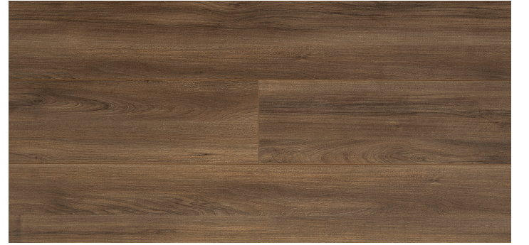
2104 - AMERİKAN CEVİZ