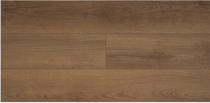
2103 - ALBERO MEŞE