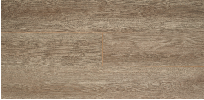
2101 - BAROK MEŞE