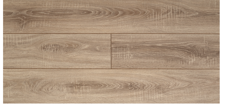
615 - RUSTİK MEŞE